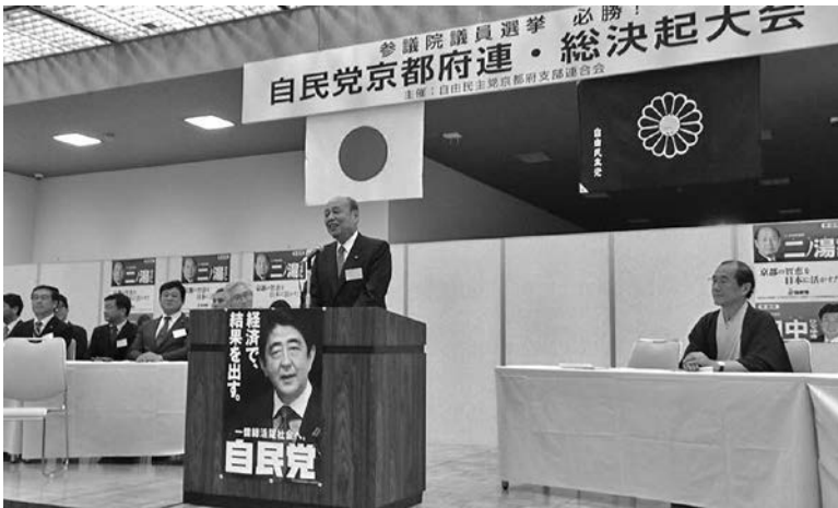
決意を語る二ノ湯議員