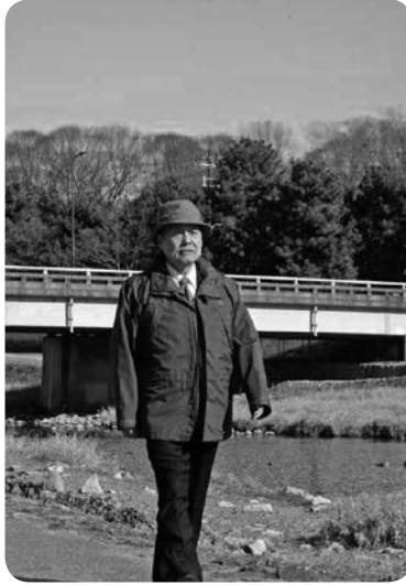
下鴨神社付近の鴨川を散歩