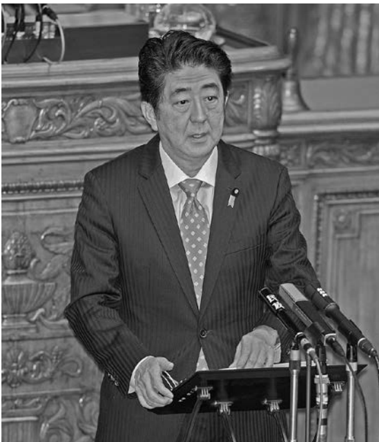
参議院本会議場で安全保障会議設置法案の趣旨説明をする安倍首相