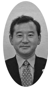
昭和39年1月29日生 (48才) 京都工芸繊維大学 大学院卒 現在、上賀茂保育園園長